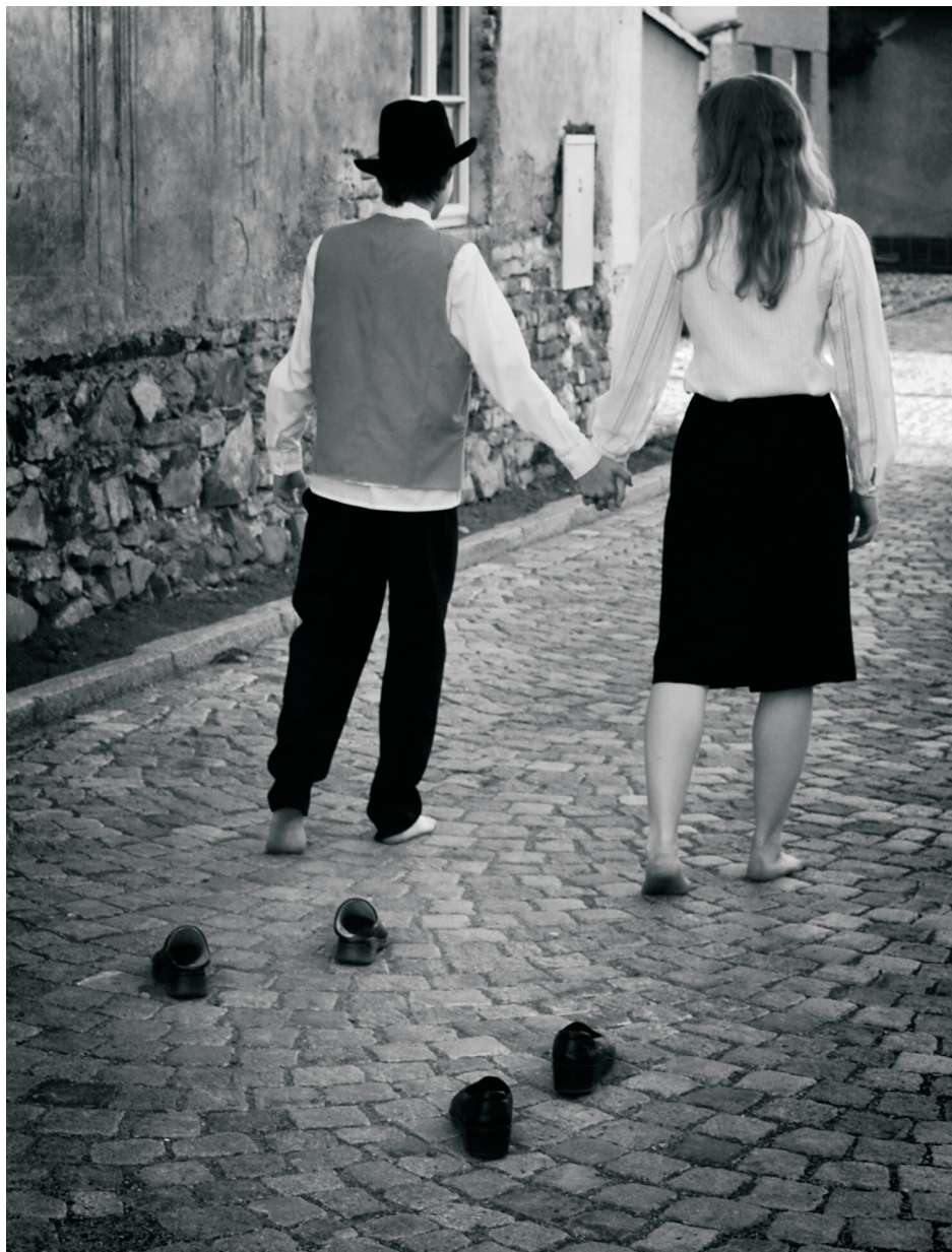
Autor: Martin Bielak