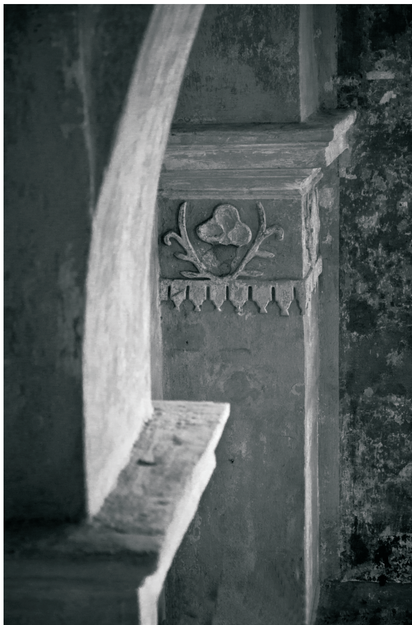
Autor: Vít Volšička