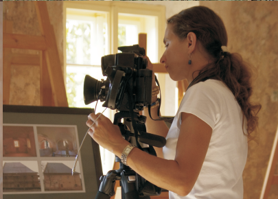
LETNÍ FOTOGRAFICKÁ DÍLNA 2011 / PO STOPÁCH RABÍNA NEUDY / LOŠTICE - ŽIDOVSKÁ SYNAGOGA