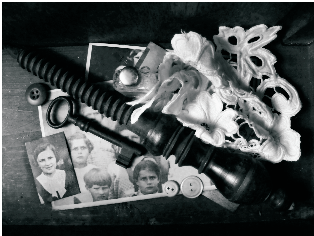
Autor: Tereza Koničková