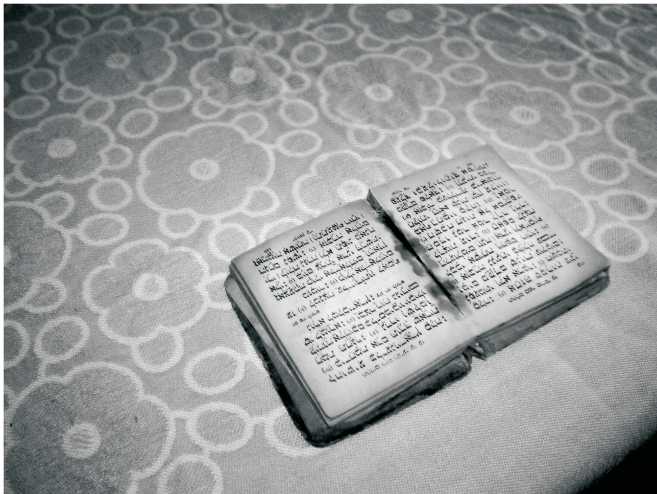
Autor: Pavel Čoupek