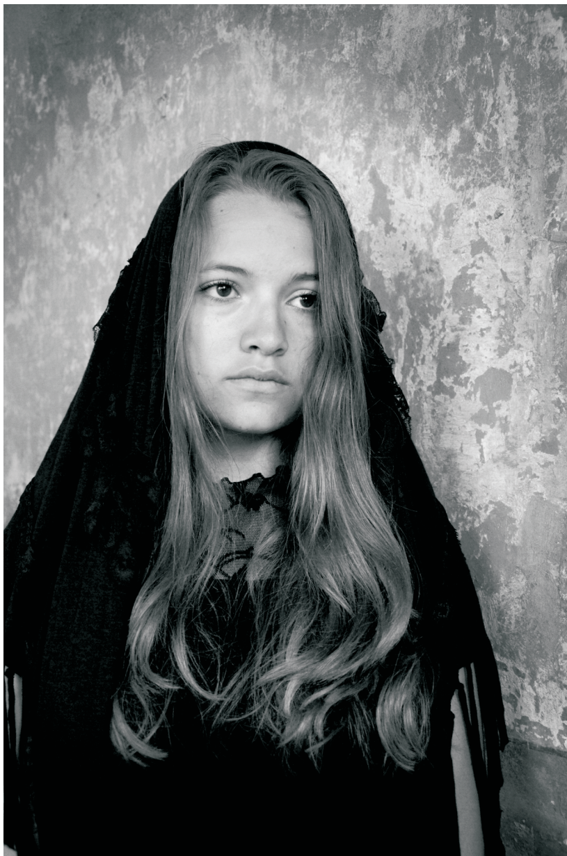
Autor: Tereza Koničková