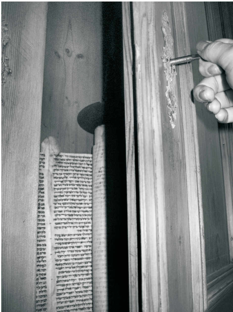
Autor: Anežka Melzrová