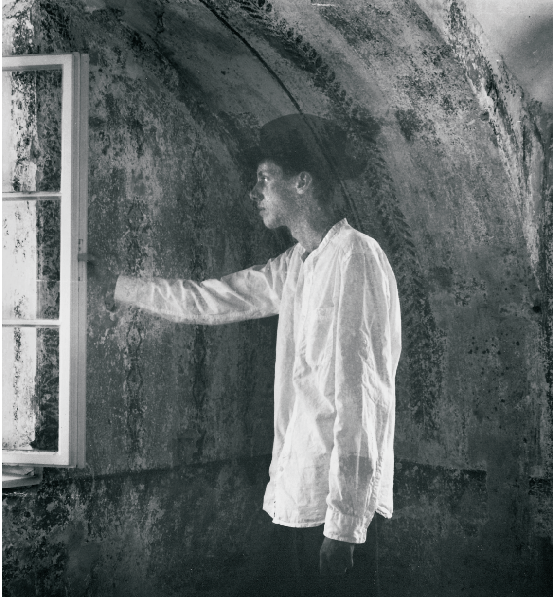
Autor: Marcela Dostálová