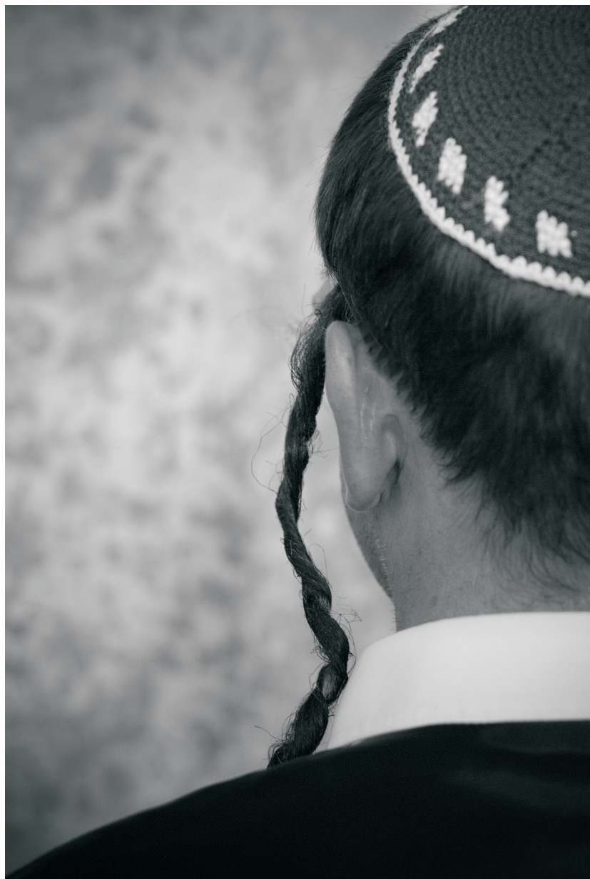
Autor: Jan Hlavička