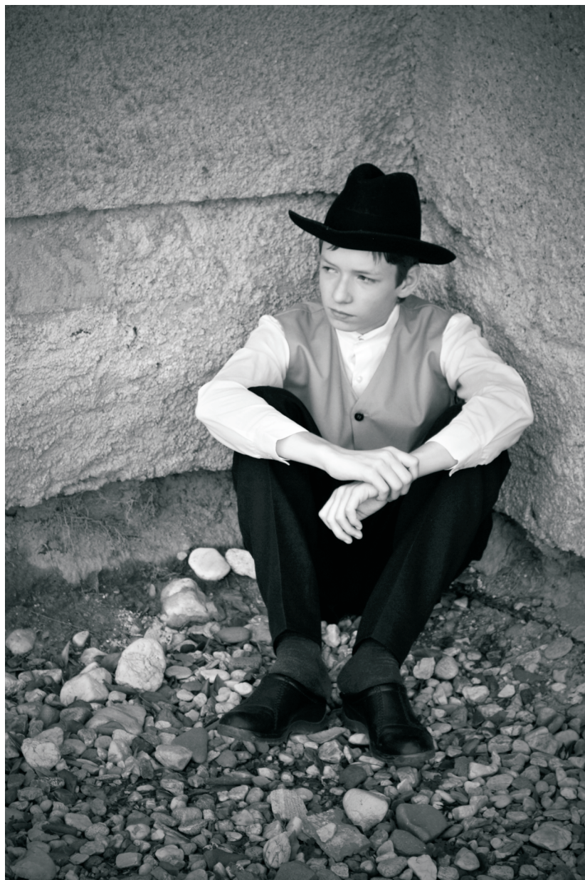
Autor: Martin Bielak